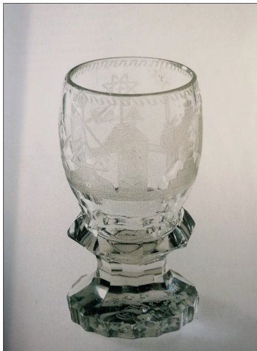
Ryc. 1. Szklanka/puchar z symbolami masońskimi, Hamburg, ok.1850 r., ze zbiorów Muzeum Historii Hamburga (wg Appel, Jaacks, Werner 2000, 45)