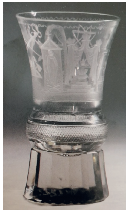
Ryc. 2. Kielich z symbolami masońskimi, Czechi/Śląsk, koniec XIX w.-1 połowa XX w., nr inwent. ZKW/1858, ze zbiorów Muzeum Zamku Królewskiego w Warszawie (wg Szkurlat 2008, 137)